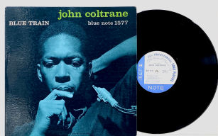
JOHN COLTRANE, BLUE TRAIN, PRESSAGE 1959. ESTIMATION: 250 - 450 EUR