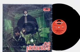
OS MUTANTES, PREMIER PRESSAGE 1968. ESTIMATION: 150 - 250 EUR