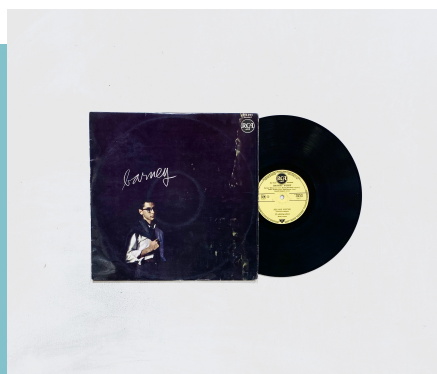
BARNEY WILEN, RCA BIEM, YELLOW LABEL ESTIMATION: 900 - 1500 EUR