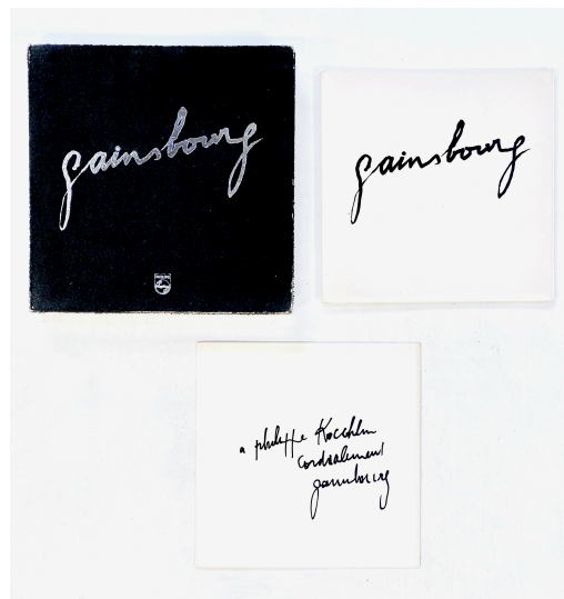
COFFRET VELOURS DE SERGE GAINSBOURG, AVEC DEDICACE DE L'ARTISTE ESTIMATION: 600 - 1000 EUR

Amoureux du jazz, qu'il considère comme l'un des plus grands genre du XXe siècle, ses archives comprennent notamment une série Vogue anniversaire illustrées de photos de Jean-Pierre Leloir, des disques rares à l'instar du 33T de Georges Arvanitas quintet, un yellow label de Barney Wilen ou encore le « Out to Lunch! » d'Eric Dolphy.