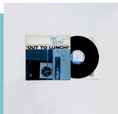
ERIC DOLPHY, OUT TO LUNCH!, BLUE NOTE, VANGELDER MATRICE ESTIMATION: 200 - 400 EUR